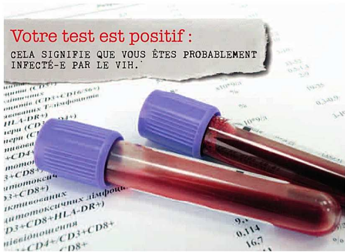
*(Virus responsable du sida).

CELA SIGNIFIE QUE VOUS ÊTES PROBABLEMENT INFECTÉ-E PAR LE VIH.